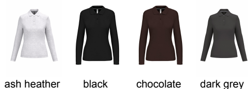
ash heather black chocolate dark grey