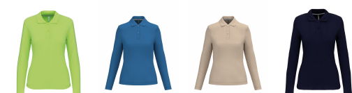
lime light royal blue light sand navy