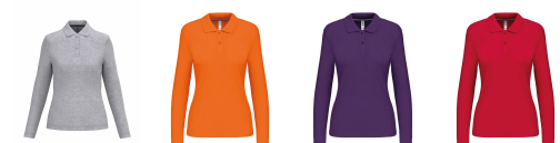
oxford grey orange purple red