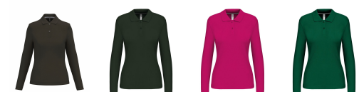
dark khaki forest green fuchsia kelly green